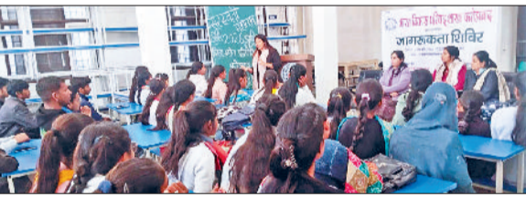
फतेहाबाद। राजकीय कॉलेज में आयोजित जागरूकता शिविर को संबोधित करते हुए वक्तागण।