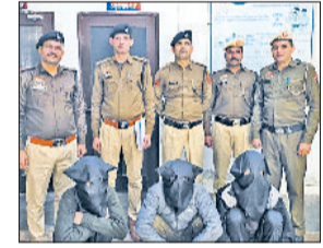
फतेहाबाद। पुलिस गिरफ्त में पकड़े गए तीनों युवक।