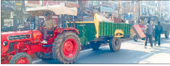
सिरसा। शहर के बरनाला रोड पर अतिक्रमण हटाओ अभियान चलाते नगर परिषद कर्मचारी।

नगर परिषद सिरसा द्वारा शुक्रवार को शहर के बरनाला रोड से अतिक्रमण हटाया गया। इस दौरान नगर परिषद की टीम ने दुकानों के बाहर अवैध तरीके से रखा सामान भी जब्त किया, जिसका पर दुकानदारों ने विरोध किया। उल्लेखनीय है कि नगर परिषद के पास शहर में अतिक्रमण को लेकर शिकायतें आ रही थी, जिस पर संज्ञान लेते हुए परिषद ने आज शहर के बरनाला रोड