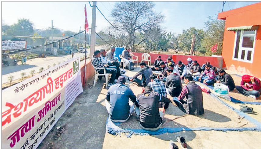
फतेहाबाद। हड़ताल को लेकर कर्मचारियों की गेट मीटिंग को संबोधित करते कर्मचारी नेता।