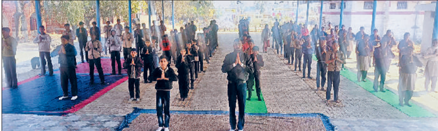
फतेहाबाद। बड़ोपल सरकारी स्कूल में सूर्य नमस्कार का अभ्यास करते विद्यार्थी।

सूर्य नमस्कार संपूर्ण शरीर के लिए एक उत्तम व्यायाम है। यह शरीर को लचीलापन, शक्ति और मानसिक शांति प्रदान करता है। यह बात गांव की एक विवाहित महिला ने पुलिस को दी शिकायत में बताया कि उसकी शादी करीब दो साल पहले हुई थी। शादी से पहले एक अन्य शादीशुदा व्यक्ति जिसके दो बच्चे हैं उसने उसे शादी का झांसा देकर रिश्तानाशिप में रखा था। पीड़ित महिला को जब इस बात का पता चला तो उसने कहीं और शादी कर ली। पीड़िता ने बताया कि शादी के समय से ही युवक उसे धमकी देकर ब्लैकमेल कर रहा है।