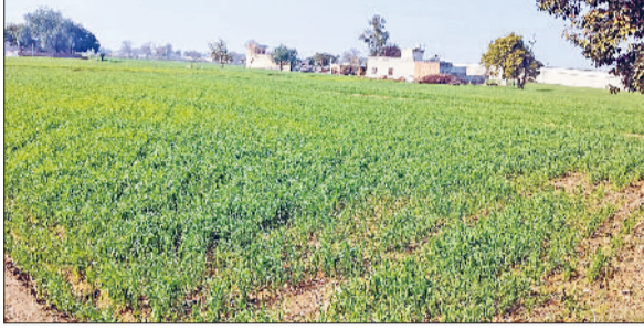
फतेहाबाद। गेहूं की फसल में आधा पीलापन व जली पतियां।

जनवरी-फरवरी महीने में तापमान कम रहने और लगातार बादल या धुंध छाए रहने के कारण गेहूं की पछेती फसल में पीलापन आना शुरू हो गया है। 8 डिग्री से कम तापमान रहने के कारण फसल में नीचे की दो पतियों को छोड़कर अन्य पतियों का हरा रंग उड़कर धब्बे बनने लगे पत्तों के मध्य में सफेद या हल्के-पीले रंग के छोटे-छोटे धब्बे बन जाते हैं। इस कारण से इन फसलों में बालियां देर से आने व उनमें बढ़ोतरी कम रहने का अंदेश बना रहता है,